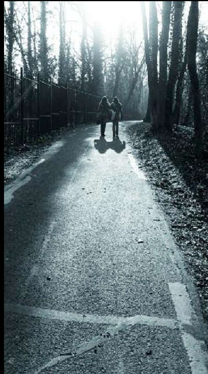
Chamboulées par la nouvelle, elles se promènent dans le parc en discutant vivement.